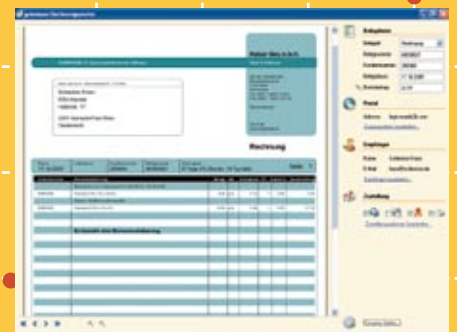
* Abb. ähnlich, entspricht Portal „Starter“