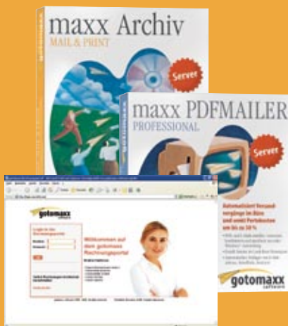
* Ab Portal 1000

Optional: XML und Signatur: Die Möglichkeit die XML-Inhalte der PDF-Belege zu publizieren und zu signieren.